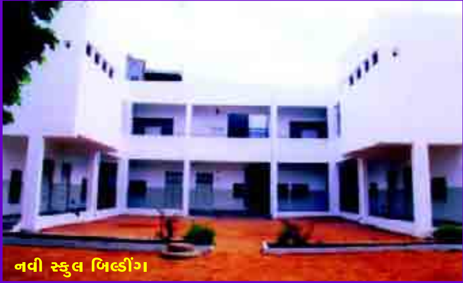
નવી સ્કુલ બિલ્ડીંગ